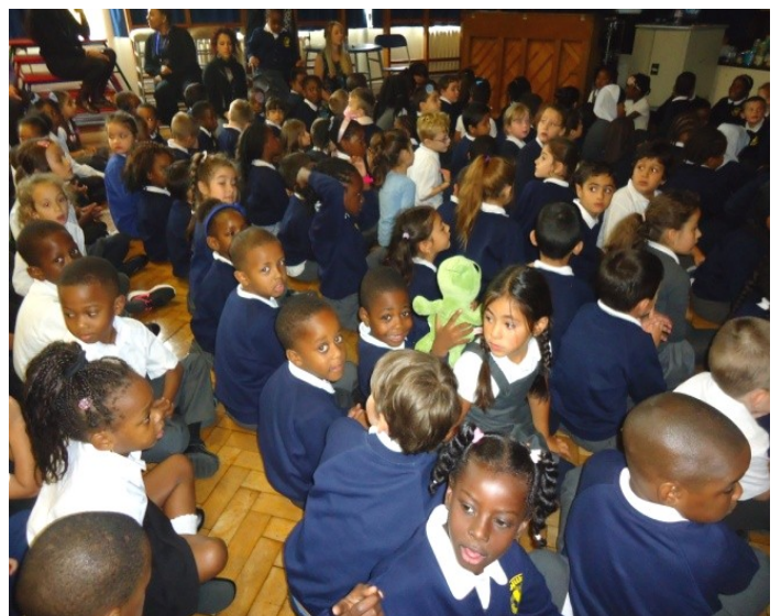
Les copains vous disent au revoir !

Ciboulette xxxx (P.S. Menthe dit bonjour aussi!)