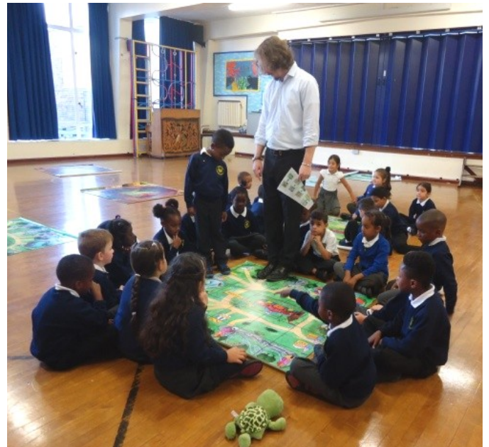
Est-ce que vous me voyez dans ce groupe ?

également participé à une leçon de calcul avec la classe 1A où nous avons appris au sujet de la programmation et du déplacement en utilisant des cartes. J'ai fait un essai !