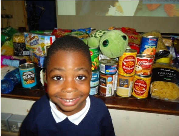
Je suis avec un copain de Wilbury devant la récolte de nourriture.

Cher journal, septembre a été un autre mois excitant ici à l'école primaire Wilbury à Londres. En Angleterre, ils ont célébré « La Journée du jardinage et des moissons ». Les enfants à Wilbury ont donné de la nourriture pour des personnes qui n'en n'ont pas eux-mêmes assez ; ils ont été très généreux !